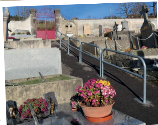
Installation d'une rampe de sécurité au cimetière