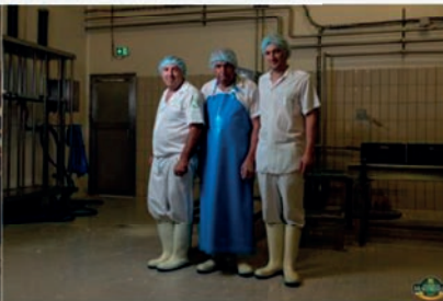
"SOCIÉTÉ FROMAGÈRE DE ST BONNET" "Fourme de Montbrison laitière lait pasteurisé" "Le Pont de la Pierre" "42940 SAINT BONNET LE COURREAU"