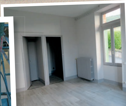
Rénovation du logement, à côté de l'école