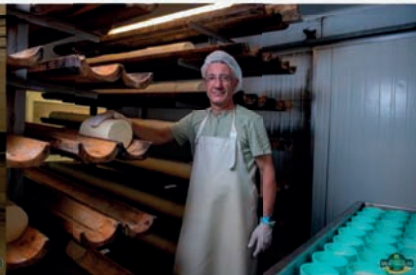
"FROMAGERIE ARTISANALE DES HAUTES" "CHAUMES" "Fourme de Montbrison artisanale lait cru - lait cru BIO" "Le Bourg" "42990 SAUVAIN"