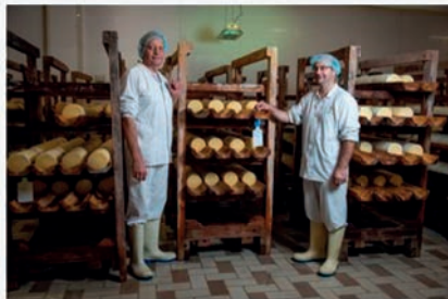
"TARIT -ENTREPRISE LAITIÈRE DE SAUVAIN" "Fourme de Montbrison laitière lait pasteurisé lait cru - lait cru bio Dizangue" "42990 SAUVAIN"