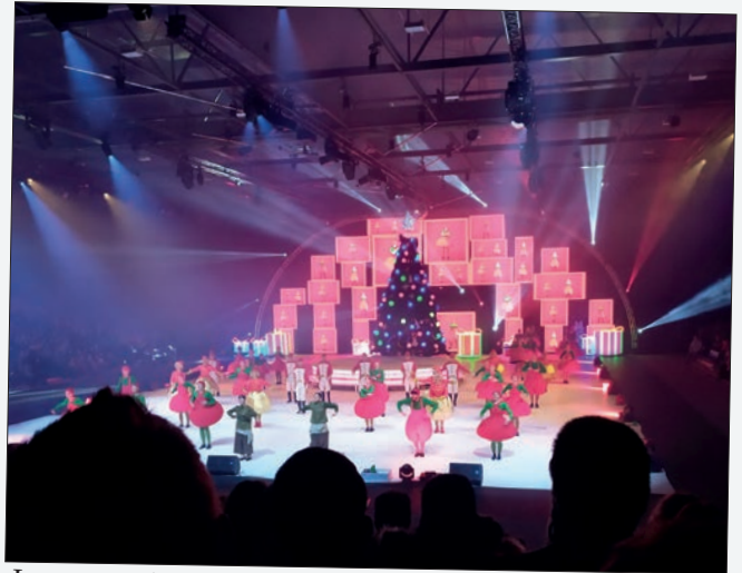
Le spectacle Val Grangent au Parc Expo à Saint-Etienne