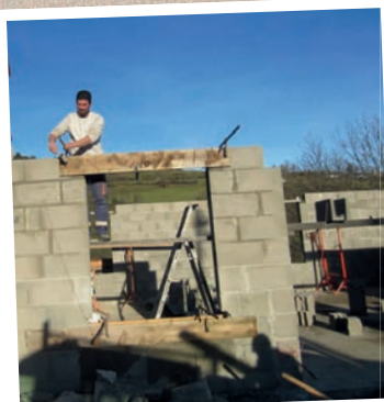
Travaux futur local technique