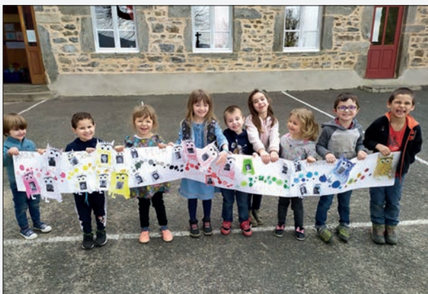
Travail en février sur les émotions avec les élèves de maternelle.