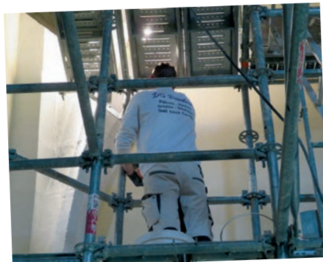
Peinture de l'intérieur de l'église