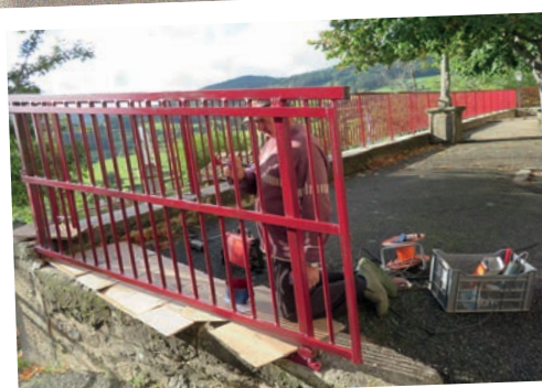
Remplacement de la barrière de sécurité de l'école