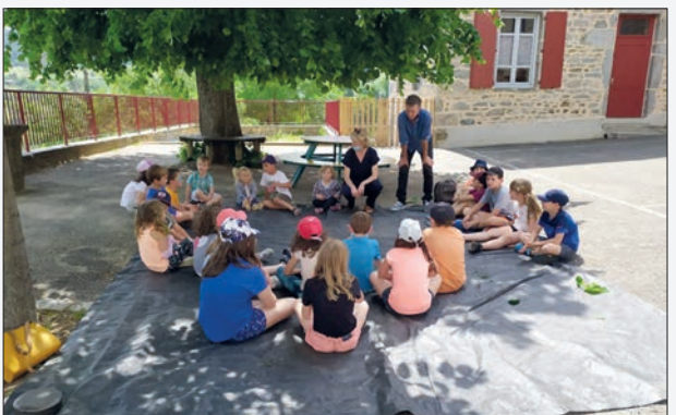
Intervention de la compagnie « Baroufada » en percussions corporelles en juin avec toute l'école.