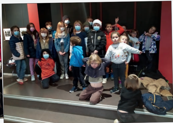
A la sortie du spectacle « Le vilain petit canard » au Théâtre des Pénitents à Montbrison