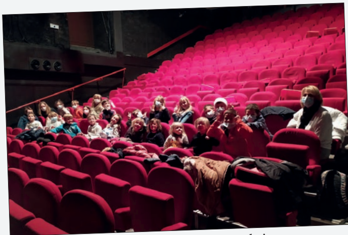
au Théâtre des Pénitents à Montbrison