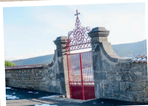
Changement du portail du cimetière