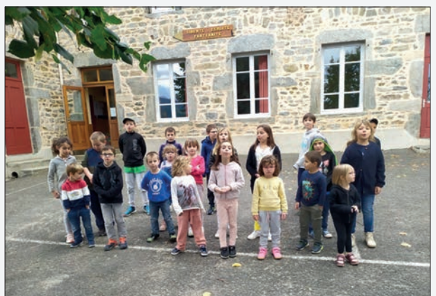
Chorale le jeudi après midi avec toute l'école.