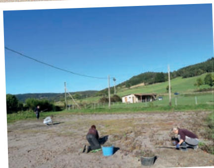
Désherbage du terrain de boules