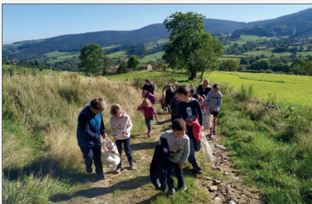
Land art avec toute l'école en octobre/novembre et projet « savoir rouler à vélo » pour la classe des grands.