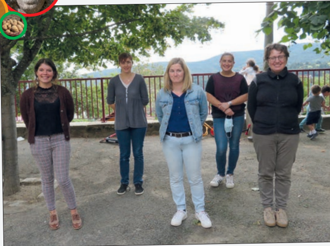
L'équipe éducative 2021/2022