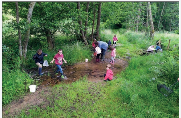
Projet sur l'eau en juin avec les élèves de la classe de maternelle et sortie à Vulcania pour toute l'école.