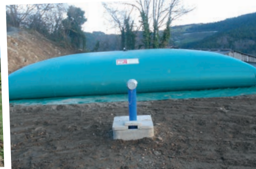
Réserve incendie de Chassery